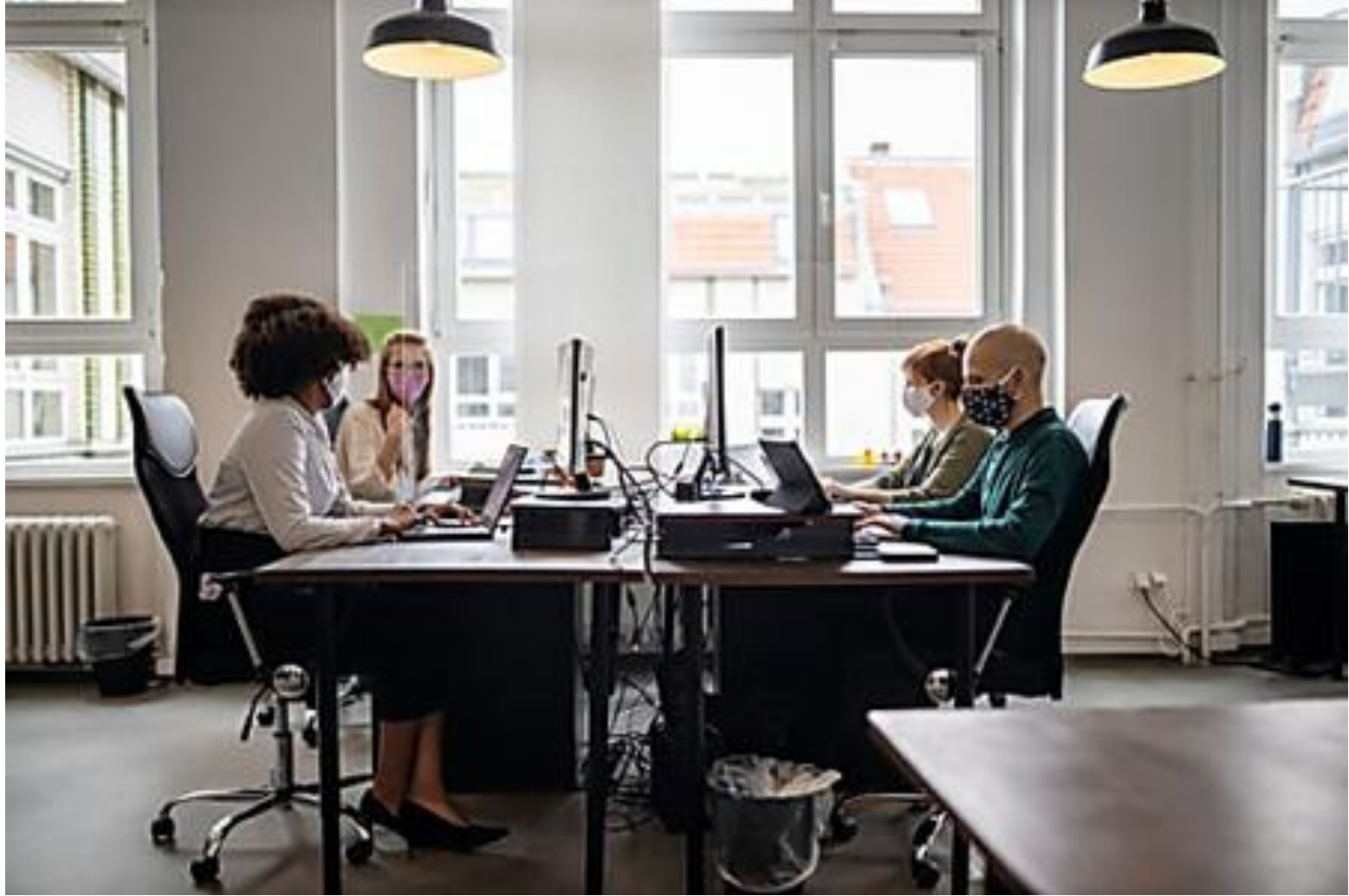
Reprise stagnante et risques de détérioration: l'impact du covid sur l'emploi est plus fort que prévu